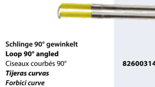
Schlinge 90° gewinkelt Loop 90° angled Ciseaux courbés 90° Tijeras curvas Forbici curve 82600314