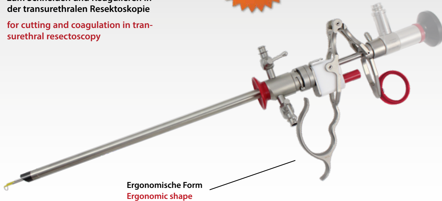
Ergonomische Form Ergonomic shape