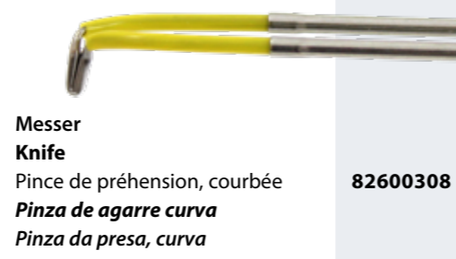
Messer Knife Pince de préhension, courbée Pinza de agarre curva Pinza da presa, curva 82600308