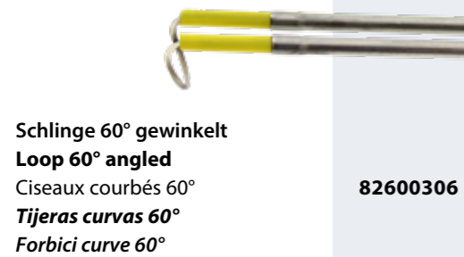
Schlinge 60° gewinkelt Loop 60° angled Ciseaux courbés 60° Tijeras curvas 60° Forbici curve 60° 82600306