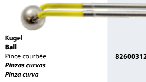
Kugel Ball Pince courbée Pinzas curvas Pinza curva 82600312